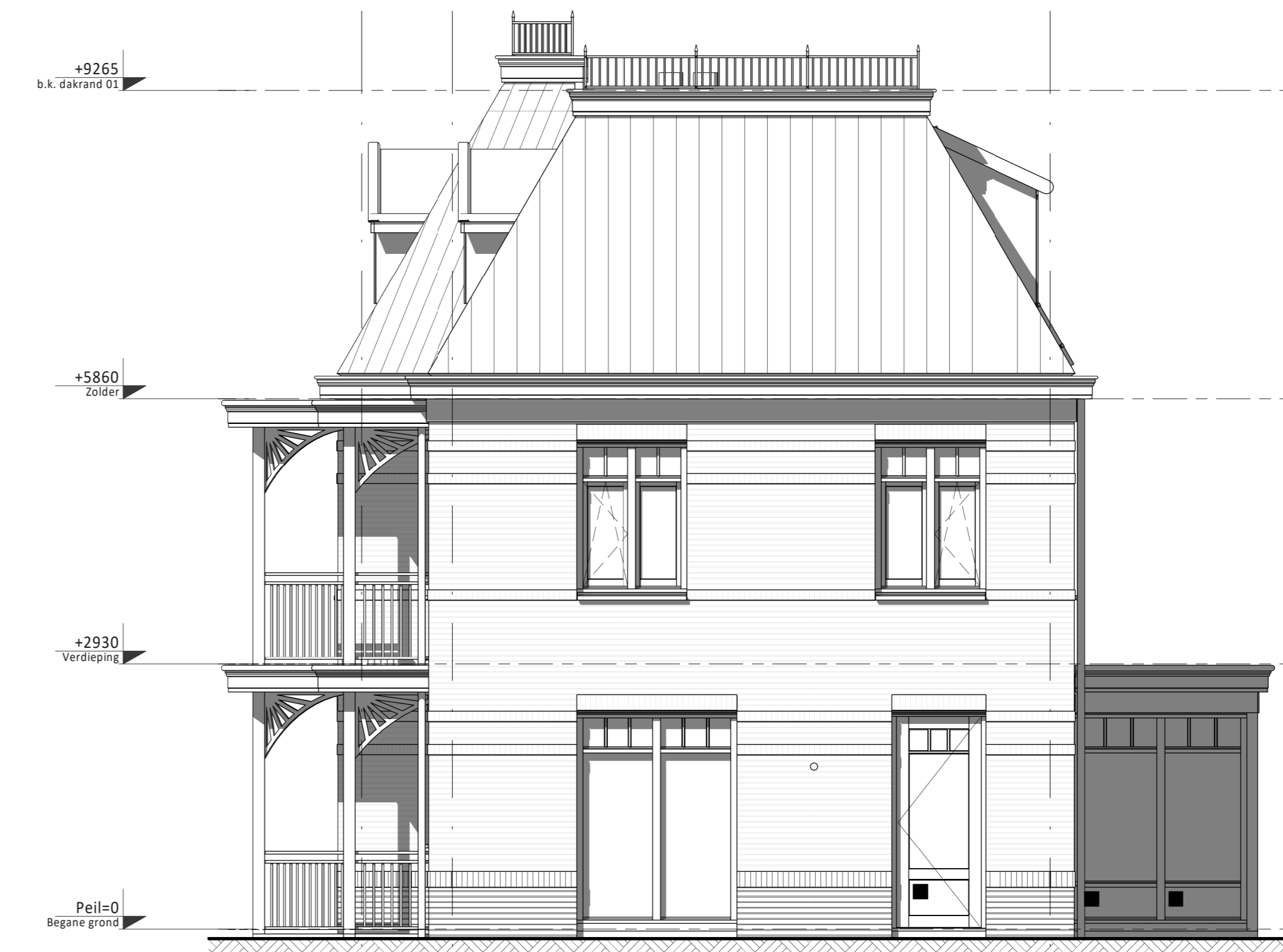
Rechter zijgevel ③ ② ① • Erker tuingevelzide i.p.v. veranda