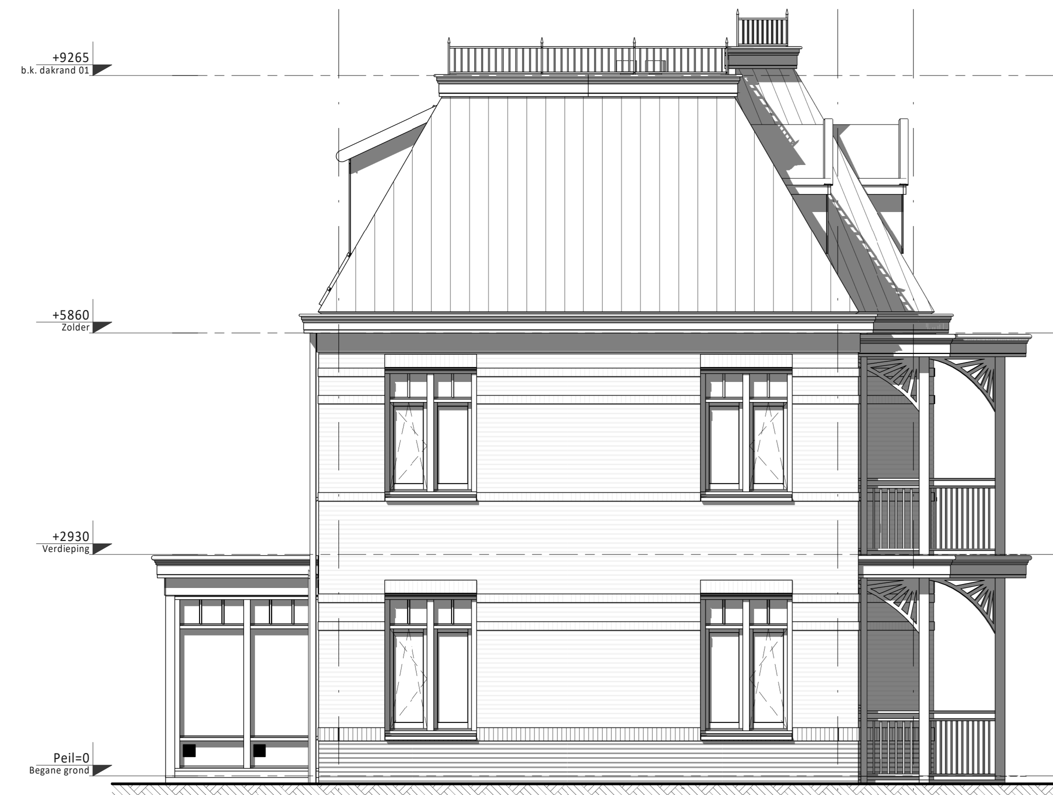
Linker zijgevel ① ② ③ • Erker tuingevelzide i.p.v. veranda