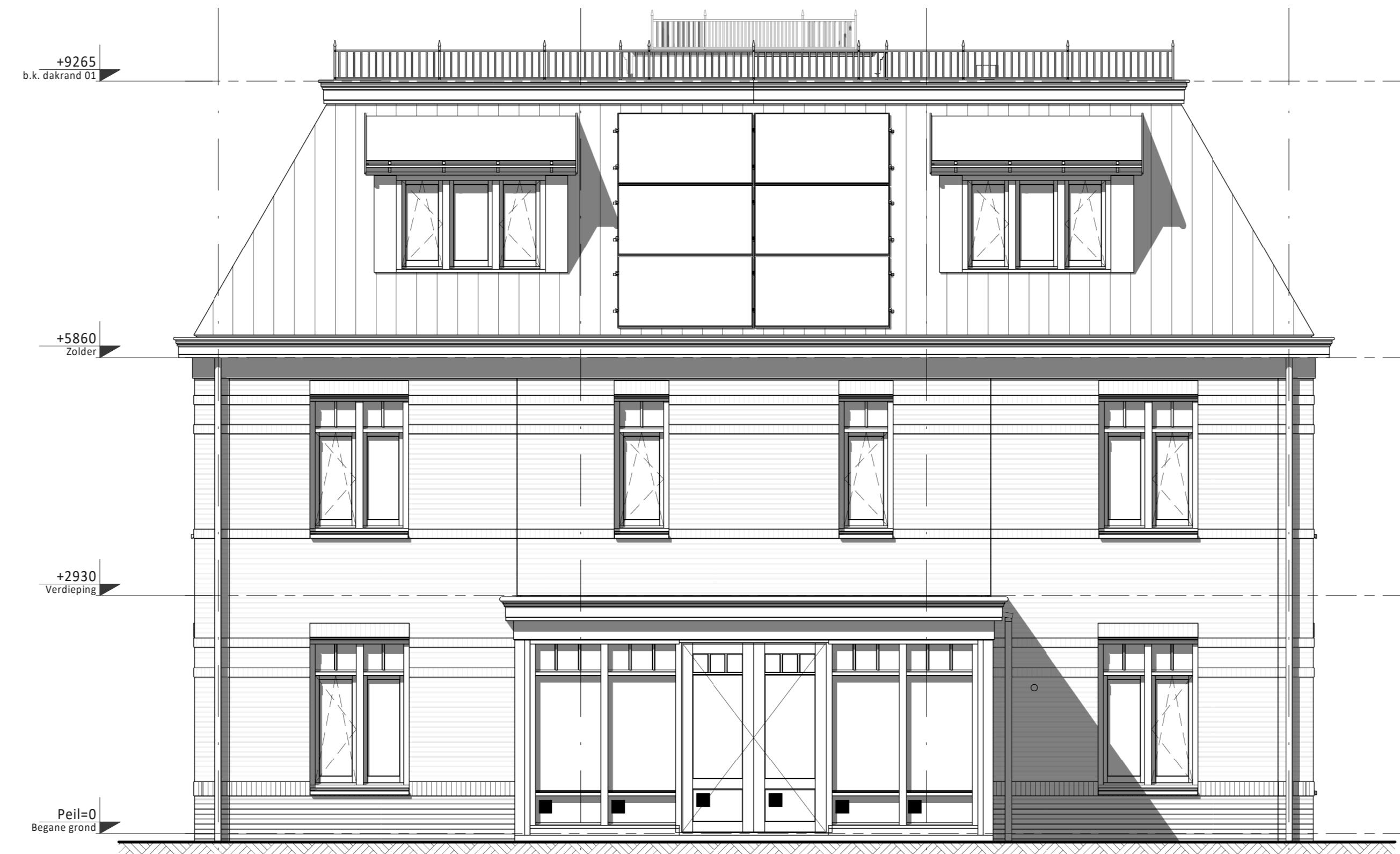
Tuingevel D C B A • Erker tuingevelzide i.p.v. veranda