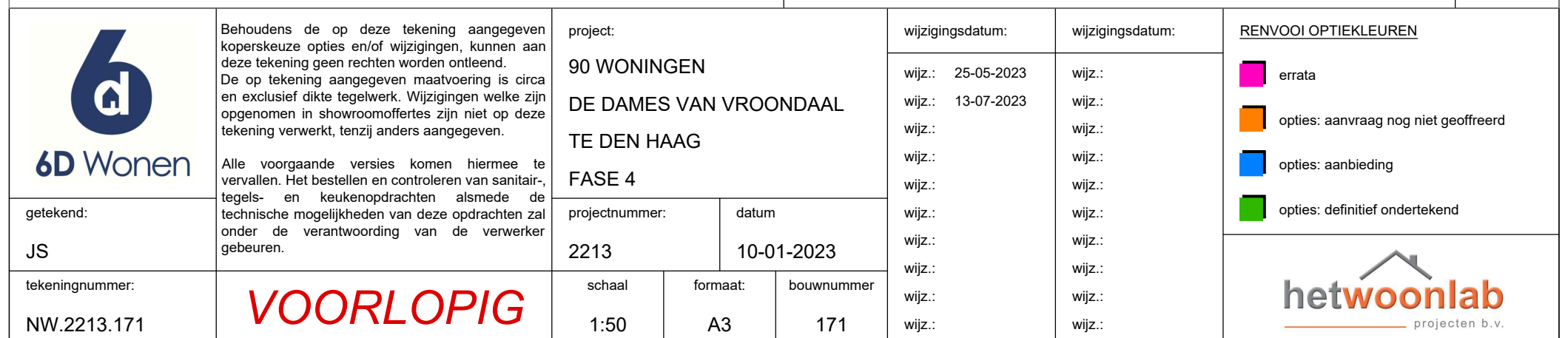
BEGANE GROND WONINGTYPE C6000 - 2 ONDER 1 KAP