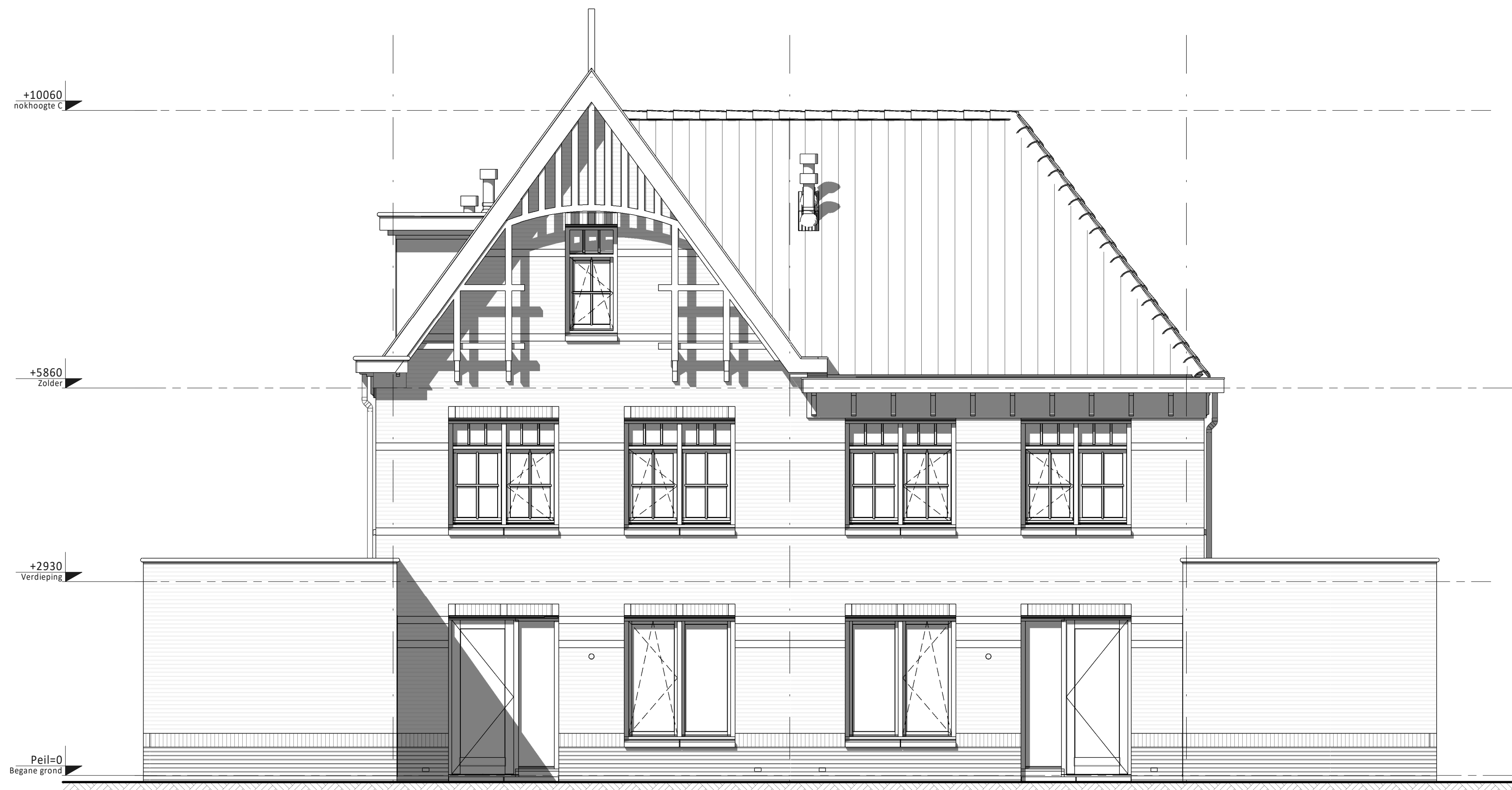
Achtergevel ③ Type D Bouwnummers 11 en 15 (als getekend) Bouwnummers 14, 18 en 20 (gespiegeld) ② Type C Bouwnummers 12 en 16 (als getekend) Bouwnummers 13, 17 en 19 (gespiegeld) ①