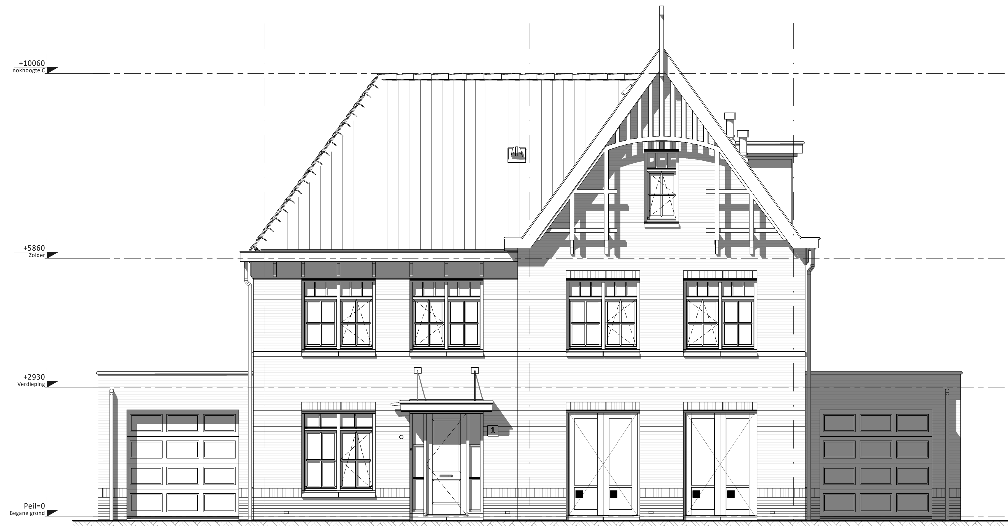
Voorgevel ① Type C Bouwnummers 12 en 16 (als getekend) Bouwnummers 13, 17 en 19 (gespiegeld) ② Type D Bouwnummers 11 en 15 (als getekend) Bouwnummers 14, 18 en 20 (gespiegeld) ③