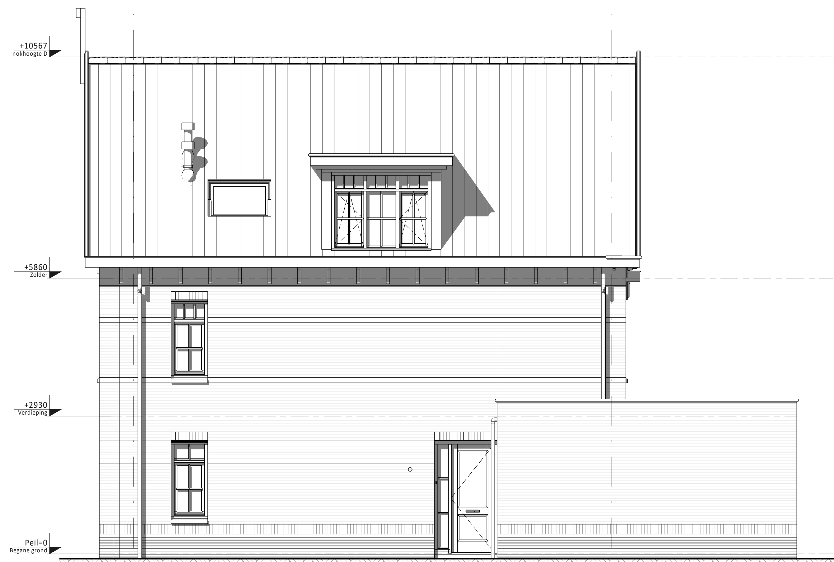
Rechter zijgevel ① A Type D Bouwnummers 11 en 15 (als getekend) Bouwnummers 14, 18 en 20 (gespiegeld) B