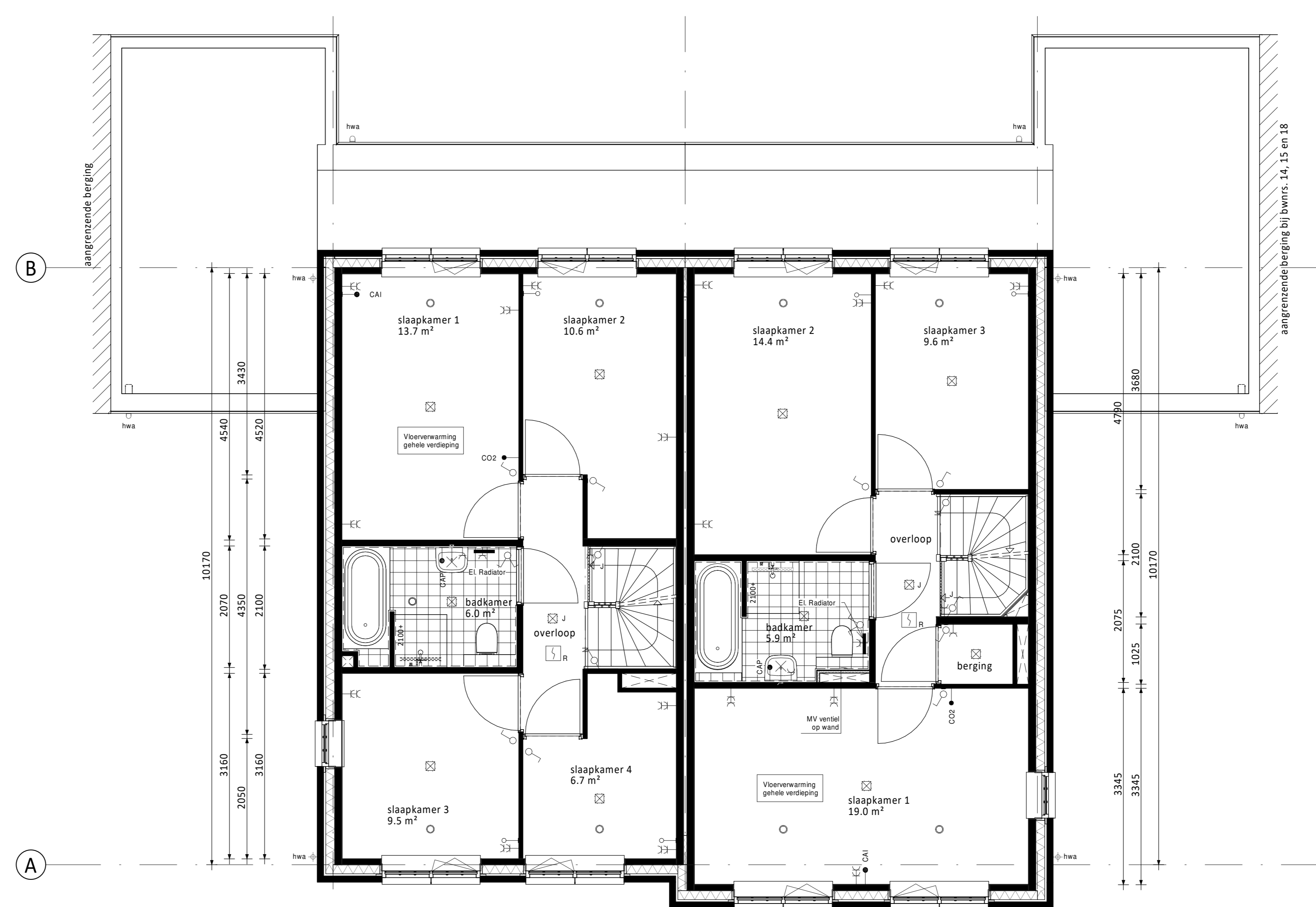
Verdieping 1 Type C • Aanbouw 1,8m achtergevel (op de begane grond) 2 Type D • Aanbouw 1,8m achtergevel (op de begane grond) 3